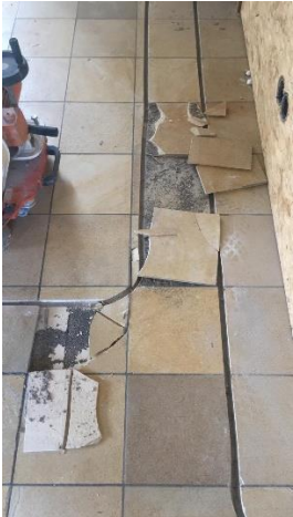
Voorbeeld losgekomen tegelvloer

Als er geëgaliseerd moet worden dan dient dit te gebeuren voordat de vloerverwarming wordt aangebracht. Als de vloerverwarming wordt ingeslepen dan dient er een "normale" afwerkvloer aanwezig te zijn, b.v. cement of anhydriet (geen tegels, plavuizen of betonvloer).