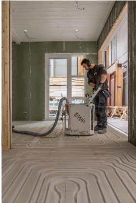
Voorbeeld ingeslepen vloerverwarming

De ruimte/ vloer moet leeg zijn en de vloer waar de vloerverwarming aangelegd moet worden dient bezemschoon, droog, uitgehard, vlak en egaal te zijn.